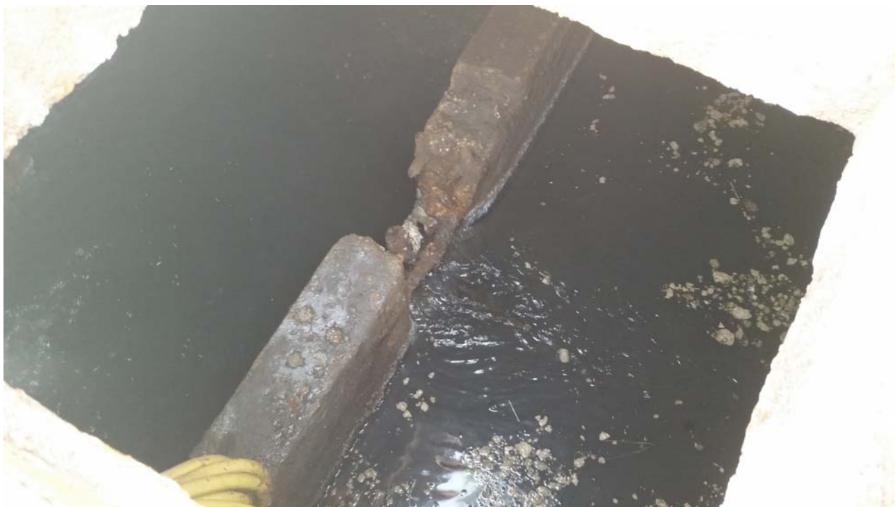
Fotografia 03 – Vasca di alloggiamento delle pompe