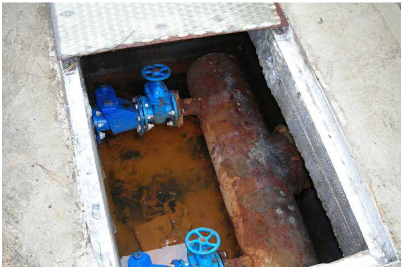
Fotografia 04 – Camera di manovra