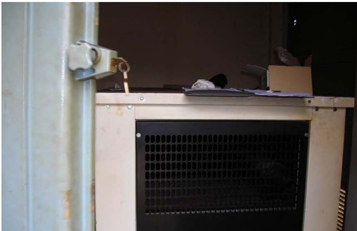
Fotografia 06 – Gruppo elettrogeno