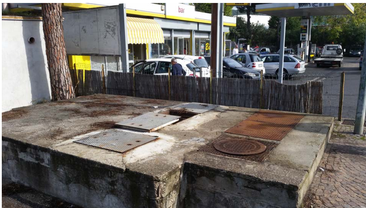
Fotografia 02 – Vista esterna