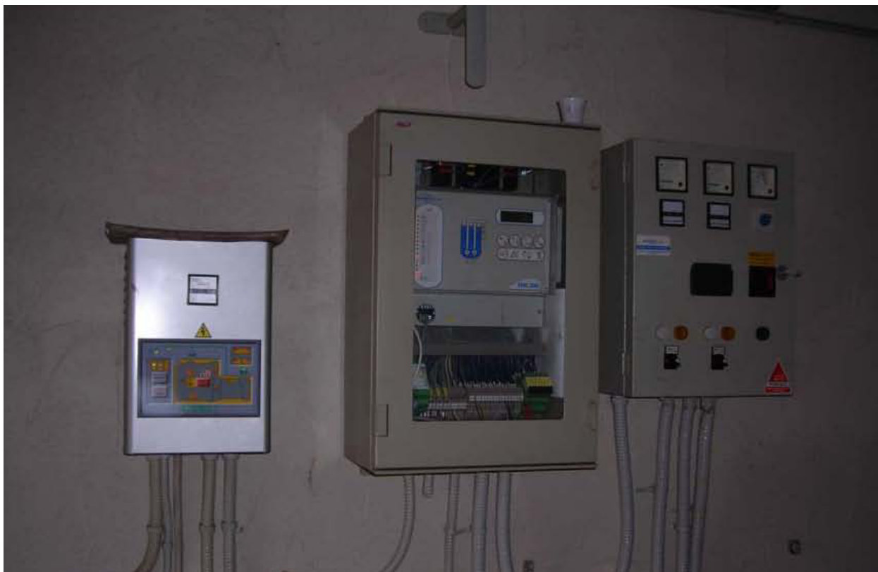
Fotografia 05 – Misuratore Enel e quadri elettrici