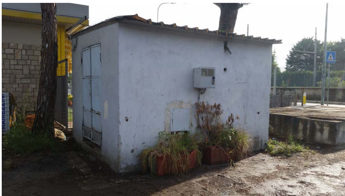
Fotografia 01 – Vista esterna

Nel presente paragrafo si riportano alcune fotografie relative all'impianto nei punti più significativi dell'impianto di sollevamento di Lido Giardino .